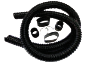
Kit connessione aspirazione (consegnato con compressore)