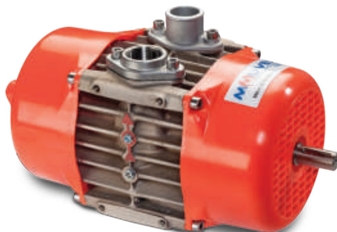
Compressore a palette E140

Peso: 36 kg (79 lbs.) to 47 kg (104 lbs.)