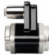
Kit valvola sicurezza e non ritorno integrate (Consegnato con compressore)

I compressori Serie Enterprise sono disponibili per le varie versioni PTO e per azionamento da motore idraulico. Gli accessori disponibili sono: