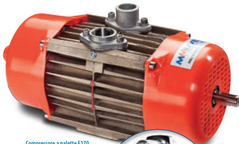
Compressore a palette E170