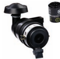
Filtro di Aspirazione (opz)