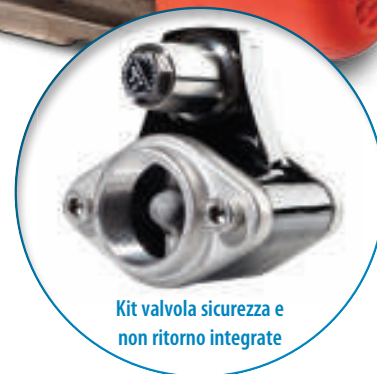
Kit valvola sicurezza e non ritorno integrate