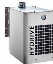
Radiatore idraulico HydriDrive (opz)