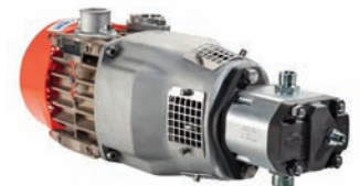
Compressore con adattatore e motore idraulico (opz)